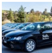
Flotte von Salt

Grâce à sa batterie Z.E. 40 (41 kWh) et son moteur R110 avec 80 kW (108 ch), Renault ZOE atteint une autonomie de 300 km sous des conditions réelles. Depuis son lancement en 2012, Renault a su pratiquement doubler l'autonomie de sa citadine compacte. Renault ZOE est la voiture la plus vendue en Suisse en 2018 et consolide ainsi sa place de leader sur le marché des voitures électriques grand public.