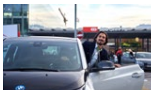
SBB Green Class