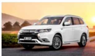
Mitsubishi Outlander PHEV

L'électromobilité est notre avenir – mais notre infrastructure n'est pas prête! Si plusieurs voitures électriques sont rechargées en même temps, le raccordement de la maison peut être surchargé. Notre système de gestion dynamique de la charge peut recharger tous les véhicules électriques sans extension onéreuse du raccordement de la maison. Nous offrons des solutions de recharge pour les clients privés et les services publics avec connexion au cloud et interfaces pour la facturation par le gestionnaire ou par l'intermédiaire de la compagnie d'électricité. Invisia – l'avenir est à venir!